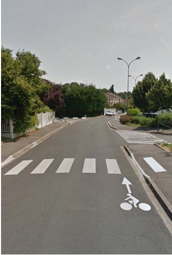
Voie partagée (Rue Albert Fouilleret)