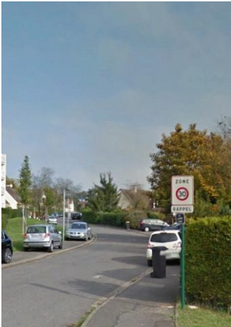
Zone 30 (Résidence du Parc de Villiers)