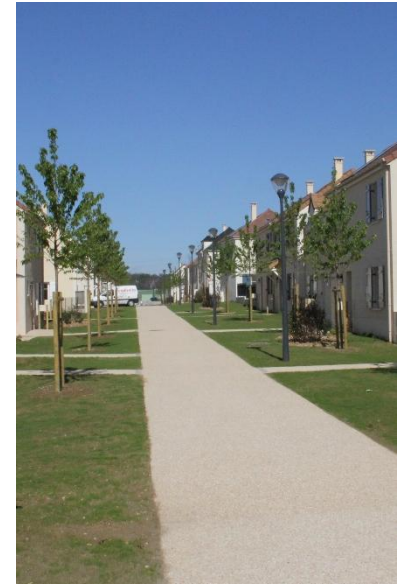
Cheminement piéton au clos de Brinvilliers