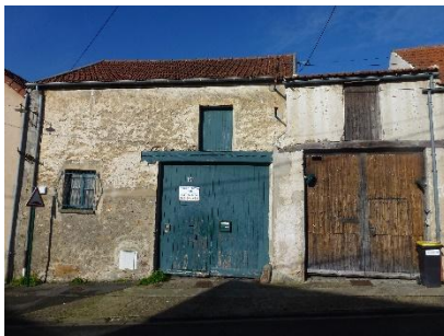
Les portes cochères

Les constructions nouvelles qui seront réalisées dans le centre ancien devront respecter l'ensemble des prescriptions déclinées dans la présente Orientation d'Aménagement et de Programmation. Elles devront ainsi s'inscrire dans une approche urbaine et architecturale cohérente avec l'environnement si particulier et spécifique du centre ancien de Villiers-sur-Orge.